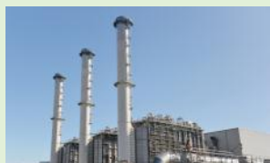
株式会社扇島パワー